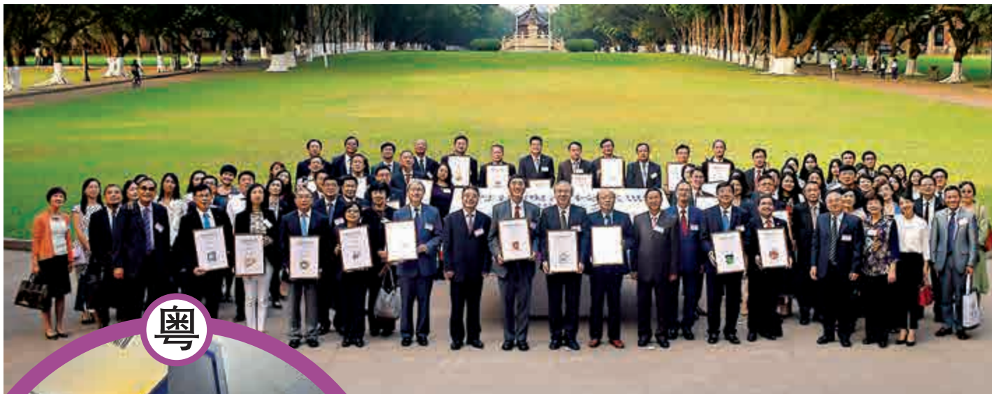
▲粵港澳高校聯盟15日正式成立，來自粵港澳三地26所高校代表在中山大學合照

澳門特區政府高等教育輔助辦公室主任蘇朝暉稱，粵港澳在教育上溝通往來已經很密切。「相信未來三地師生間會有更多交流合作。」